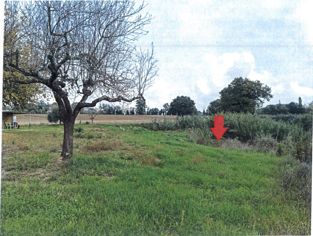
Vista da proprietà Rossetti – sponda sinistra fiume Nevola