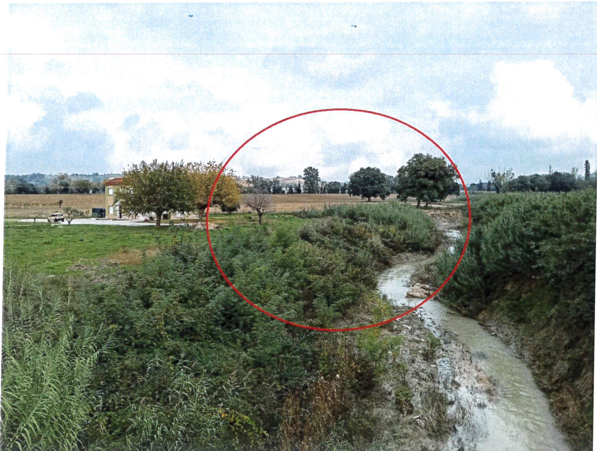
Vista da Ponte del Burello – sponda sinistra fiume Nevola

Comune di Corinaldo Prot. n. 0008608 del 28-10-2024 partenza Cat. 6 Cl. 4