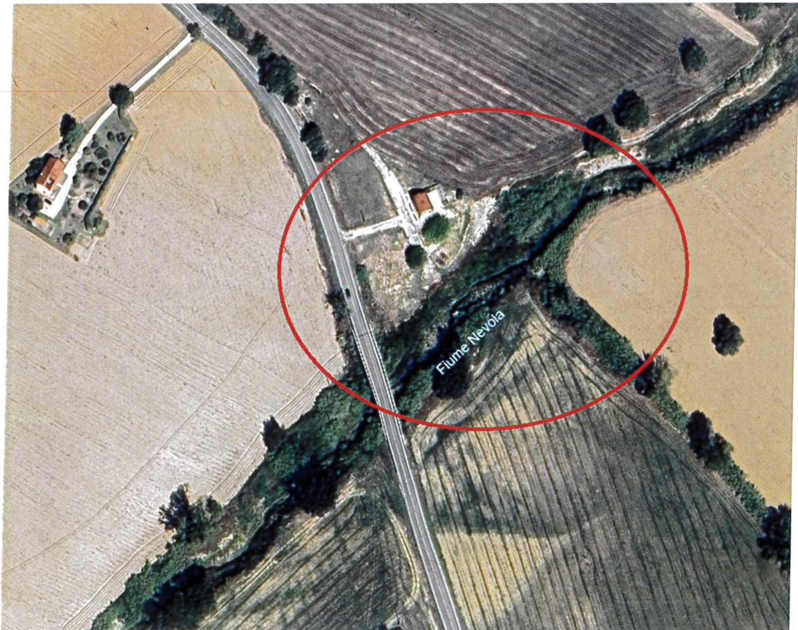
Fig. 2 - identificazione intervento